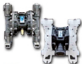
Doble puerta de Entrada y Salida