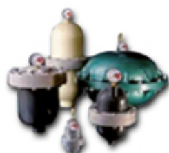
Amortiguador de Pulso