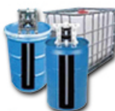
Bombas para Estanques y Tambores